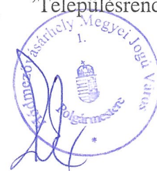
Dr. Márki-Zay Péter polgármester

az Elektronikus Térségi Tervezést Támogató Rendszer (E-TÉR), valamint a város hivatalos honlapja ( https://www.telepulesrendezes.hodmezovasarhely.hu/ 'Településrendezés', 'Véleményezés') eléréssel.